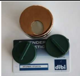
Kit defender "Key Protector" avec clés et carte de propriété